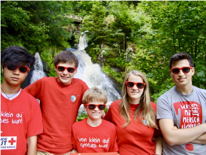
Schulanitätsdiensttag des Badischen Jugendrotkreuz in Triberg 2017, hier an den Wasserfällen

vorsichtigen Öffnungen 2022 gab es die Möglichkeit für Freiluft-Angebote für Gruppenabende mit Smartphone-Ralleys, usw.. Nach und nach waren dann 2022 einzelne Dinge wieder möglich, aber irgendwie war alles anders. Langjährige Angehörige und Leitungskräfte hatten mittlerweile andere Themen als die Jugendrotkreuz-Arbeit. Motivation fehlte, es war quasi die Stunde Null des Neubeginns. Zum Durchstarten brauchte es Begegnungspunkte und so wurde der Camp-Gedanke wiedergeboren und hatte mit dem Camp'22 an der Linach einen Neubeginn, der so ein kleiner Startschuss für die JRK-Arbeit war.