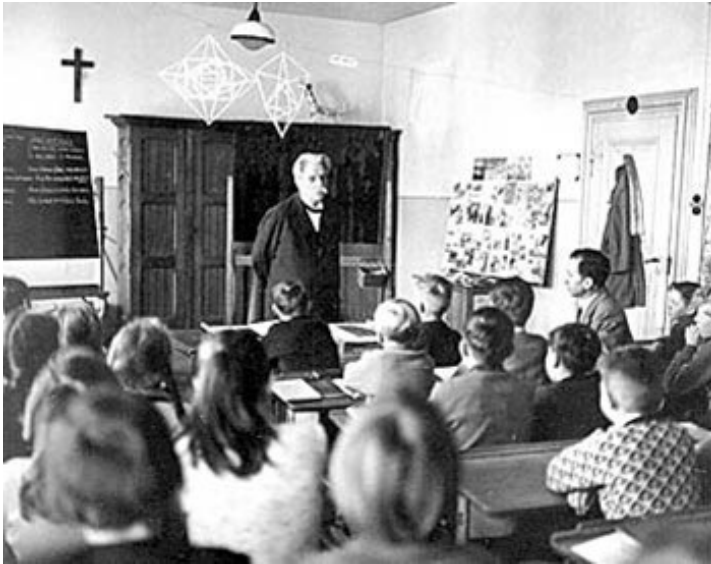
Albert Schweitzer besucht 1957 die Jugendrotkreuzklasse an der Pestalozzischule, heutige Karl-Brachat-Schule (Bild: DRK-KV)