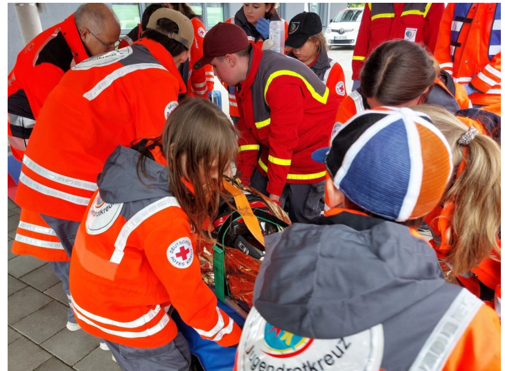
Erste 24-Stunden-Übung des Jugendrotkreuz im KV. Hier Station mit RTW bei Sturz aus hoher Höhe

2023 fand das Jugendrotkreuz-Landestreffen der Stufe 1 in VS-Villingen statt und in Königfeld-Neuhausen wurden die Zelte für das LAUTSTARK-Camp zur aktuellen LAUTSTARK-Kampagne aufgebaut. Diese beschäftigt sich mit Kinderrechten und Partizipation. Uwe Döhring erhielt bei der Jugendrotkreuz-Landesversammlung in Freiburg das Ehrenzeichen des Badischen Jugendrotkreuz, für seine besonderen Verdienste um die Aufarbeitung Verschickungskinder im DRK und sein langjähriges außerordentliches Engagement im Jugendrotkreuz. Das Bad Dürrheimer Jugendrotkreuz qualifiziert sich 2024 für den Jugendrotkreuz-Bundeswettbewerb Stufe III in Bretten. 2025 starten wir mit „Henry Dunant, der Brickfilm“ direkt ins 100jährige Jubiläum, die Premiere findet im Roten Löwen in St. Georgen statt. Das Landestreffen Stufe 1 findet in Bad Dürrheim statt und die Teilnehmenden erwarten Stationen zwischen Innenstadt und Kurpark. Zum ersten Mal gibt es eine 24-Stunden-Übung als Halbjahresabschluss für die JRK-Angehörigen. Unter dem Titel „100, 75, 65 Jahre Jugendrotkreuz, die Ausstellung“ findet in der Stadtbibliothek in VS-Schwenningen die Jubiläumsausstellung statt.