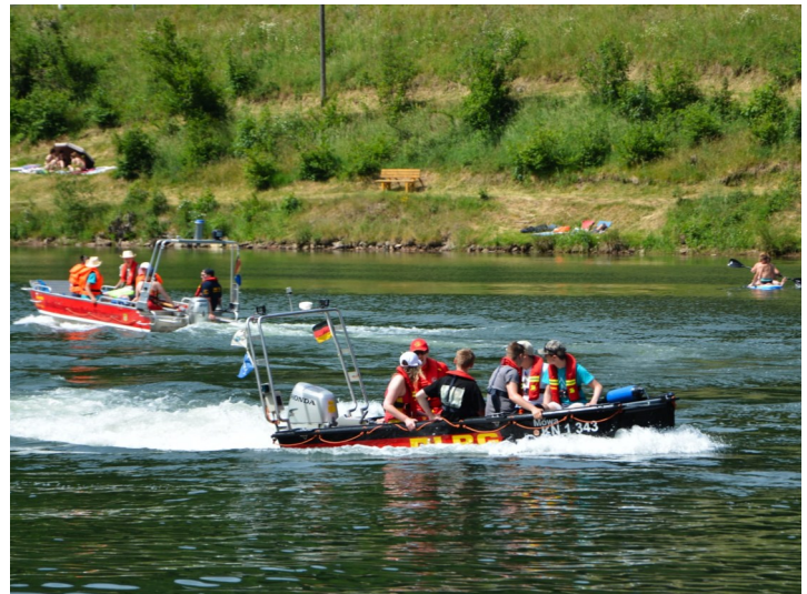
Highlight des Camps an der Linachtalsperre waren sicherlich die Bootsfahrten mit der DLRG

Irgendwie schien dann die Welt immer mehr digital durchzustarten und wir versuchten auch digitale Angebote für die Gruppenleitungen und die JRK-Angehörigen zu schaffen. Ziel war es mit Abstand ein wenig Identität und Zusammenarbeit im Jugendrotkreuz zuzulassen. Nach