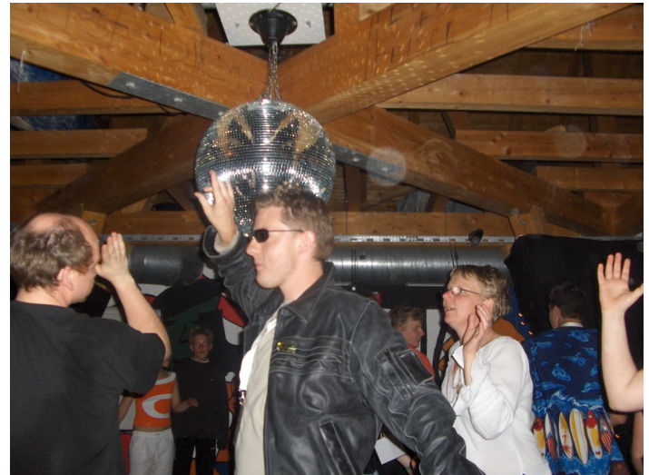
Die legendäre Disco jeden Abend beim Camp am Stöcklewald

2002 kommt es zu einem bundesweiten Aktionstag zur „Bleib COOL ohne Gewalt“-Kampagne. Wir beteiligen uns mit Aktionsständen in St. Georgen, Villingen, Schwenningen und Triberg, sowie einem Mobilteam um auf die Kampagne aufmerksam zu machen. Unter dem Motto Mittelalter findet das Camp'2002 am Stöcklewald statt. Im Juli findet das 13. Internationale Erste-Hilfe-Turnier in Stuttgart statt. Über 600 Jugendrotkreuzler treffen sich dort vier Tage lang unter dem Motto KEEP COOL - STOP VIOLENCE! und wetteiferten um Punkte und Lorbeeren. Das Camp'2003 findet unter dem Motto Hardrockcafe Stöcklewald statt und führt auf eine Zeitreise in die 70er Jahre. 2004 startet eine neue Kampagne - die bundesweite Kampagne „ARMUT: Schau nicht weg!“ (2004 -