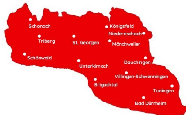
Gebiet des DRK-Kreisverband Villingen-Schwenningen

Darüber hinaus sind rund 300 Juniorhelferinnen und Juniorhelfer, sowie Schulsanis als Jugendrotkreuz-Angehörige an den folgenden Schulen im Kreisverbandsgebiet aktiv: