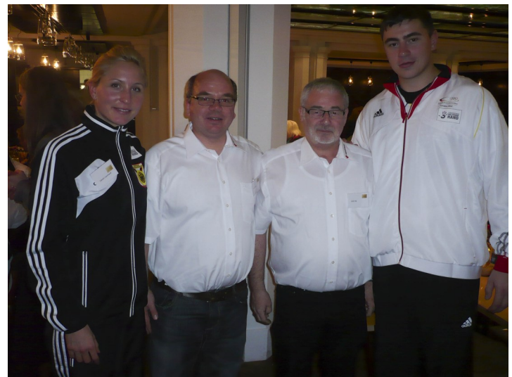
Preisverleihung Helfende Hand in Berlin beim Bundesamt für Bevölkerungsschutz und Katastrophenhilfe

2010 beteiligt sich das Jugendrotkreuz auf Kreisverbandsebene an der bundesweiten "Blut und Jung"-Kampagne des Jugendrotkreuz mit dem Blutspendendienst. Hierzu wird ein Sonderblutspendetermin für Junge Menschen in der Villa Bürk in VS-Schwenningen organisiert. Dabei gab es Public Viewing zur Fußball-WM und ein Tipp-Kick-Turnier. Die Landesgartenschau in Villingen