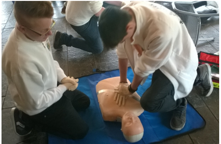
Erste Hilfe Gruppenaufgabe beim Kreistreffen 2014 Neckarpark Schwenningen, hier Gruppe St. Georgen