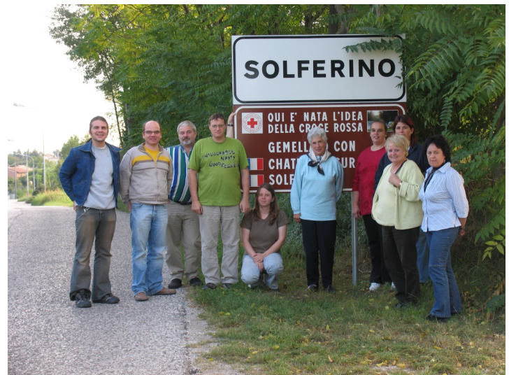
Im Herbst 2005 führt eine Studienfahrt zu den Wurzeln des Roten Kreuz, mit Teilnehmenden aus allen Rotkreuz-Bereichen

2006 findet das Camp als Landeszeltlager des Badischen Jugendrotkreuz unter dem Motto "Die Siedler" am Stöcklewald statt. 2007 lädt zu Pfingsten das fünfte JRK-Supercamp ein. Hier treffen sich über 1000 JRKler/-innen aus Deutschland, Österreich, Luxemburg und der Schweiz in Heddesheim/Baden-Württemberg, um dort gemein-