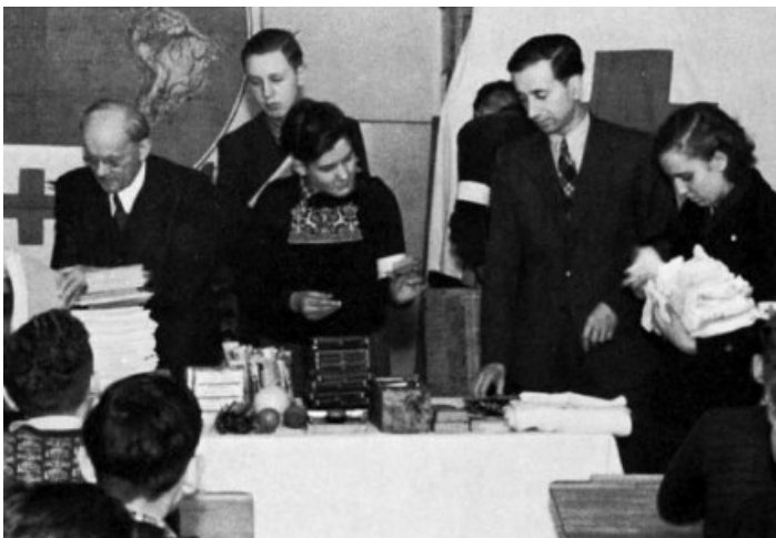
Geschenk aus d. USA, JRK-Schulklasse Villingen

Angeregt durch Albert Schweitzers Schriften fertigte die Jugendrotkreuz-Klasse 1953 einen Triptychon (dreiteiligen Altar) für das Urwaldhospital Albert Schweitzers in Lambarene. Die Lambarene Organisation und Albert Schweitzer bedankten sich prompt. 1954 wurde die Lambarene-Aktion erweitert: es wurden Werkzeuge, Verbandstoffe, chirurgische Instrumente und ein Dschungradio (gestiftet von Saba) gesammelt und so vier große Kisten für den Versand nach Lambarene fertig gemacht und zu Albert Schweitzers 80. Geburtstag 1955 geliefert. Ein Dankeschreiben folgte und 1957 kam es zu