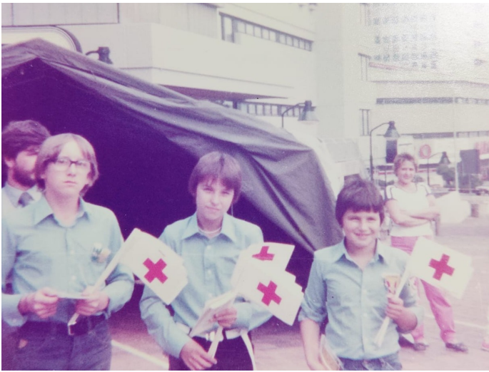
Jugendrotkreuz-Angehörige beim Weltrotkreuz-Tag auf dem Muslenplatz, ca. 1980

einem Anruf aus Königsfeld, in dem Albert Schweitzer mitteilte, dass er die Jugendrotkreuz-Klasse besuchen möchte um sich für ihr Engagement persönlich zu bedanken Und das geschah dann noch am selben Tag, eiligst wurden die Schüler der Jugendrotkreuz-Klasse aus den verschiedenen Jahrgangsstufen zusammengerufen um den Besuch von Albert Schweitzer an der Pestalozzischule beizuwohnen.