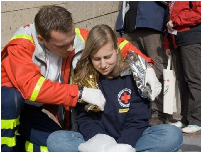
2008 findet der 10. Jugendrotkreuz-Bundeswettbewerb der Stufe III in Villingen statt, hier Erste Hilfe an der Tonhalle

sam Rotkreuz-Spirit zu erleben, zu feiern, Freunde zu finden und in vielen Workshops neue Erfahrungen zu sammeln. Beim Supercamp fällt auch der Startschuss für die grenzüberschreitenden Kampagne „Deine Stärken. Deine Zukunft. Ohne Druck!“. Sie hat den wachsenden gesellschaftlichen Druck auf Kinder und Jugendliche zum Thema. Mit der Kampagne setzen sich JRKler/-innen aus Deutschland, Österreich, der Schweiz und in Luxemburg dafür ein, dass Kinder und Jugendliche mehr Möglichkeiten erhalten, ohne Druck ihre Stärken zu entdecken, ihre Fähigkeiten zu testen und Herausforderungen zu meistern.