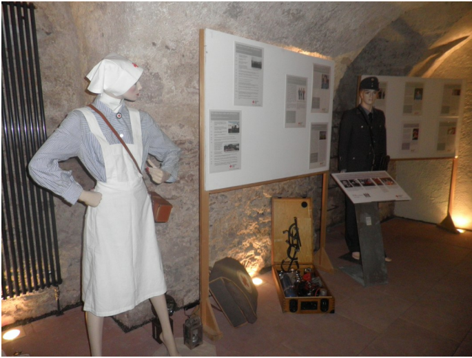
Ausstellung zu 150 Jahre DRK: Menschen, Herzen, Emotionen im Abt-Gaiser-Haus in VS-Villingen

-Schwenningen ist Gastgeber zahlreicher Rotkreuz-Veranstaltungen, das Jugendrotkreuz beteiligt sich am Rotkreuz-Tag auf der Landesgartenschau mit einem Informationsstand und veranstaltet den Schulsanitätsdienst-Tag des Badischen Jugendrotkreuz auf dem Landesgartenschau Gelände. Mit den Bausteinen zur Prävention baut das Jugendrotkreuz ein Präventionssystem zum Schutz Kinder und Jugendlicher vor sexueller Gewalt für alle Gliederungen des DRK-Kreisverbandes Villingen-Schwenningen auf.