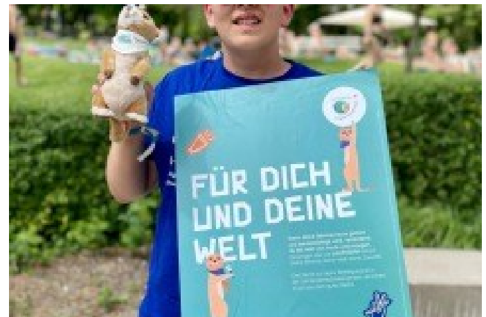
LAUTSTARKE Engagement für Kinderrecht beim LAUTSTARK-Camp 2023 in Königsfeld-Neuhausen