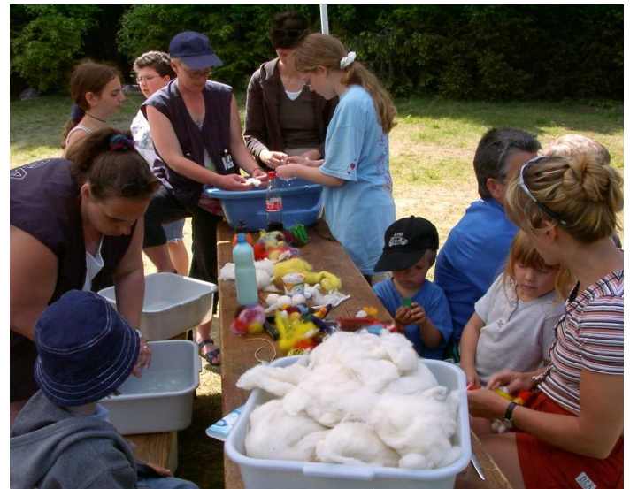
Workshop Filzen beim Camp 2002 am Stöcklewald

1996 fährt eine Delegation des Jugendrotkreuz im DRK-Kreisverband zu einem Besuch der Partnerbezirke in Budapest. Es folgen 1997 und 1998 Gegenbesuche des Bu-