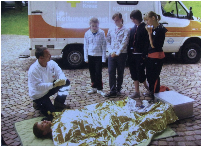
Schulsanitätsdiensttag des Kreisverbandes in Tribberg 2004, Station mit Rettungswagen am Kurhaus

sammen mit der Deutschen Bahn. Auch aus dem Kreisverband Villingen-Schwenningen kommen Betreuer für dieses Projekt.