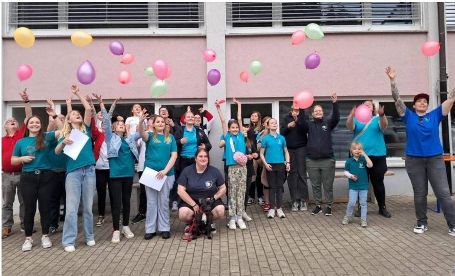
Abschlussbild beim Jubiläums-Kreistreffen Stufe 1 2025 in Triberg