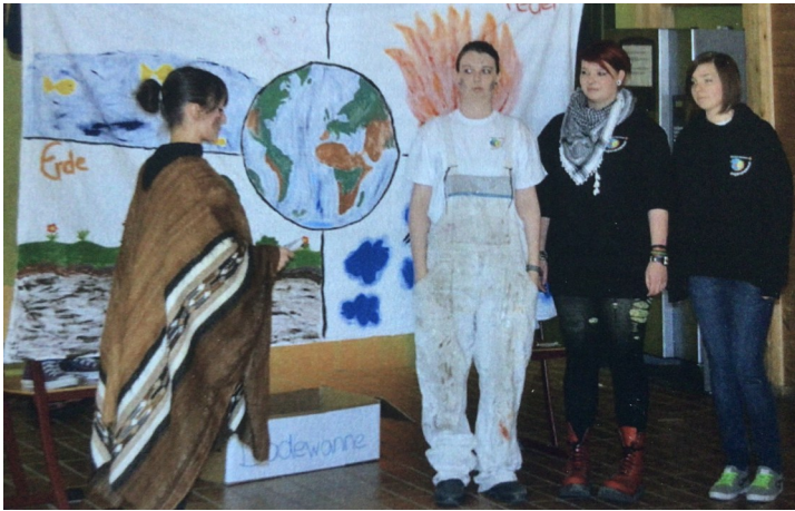
Musisch-Kulturelle Aufgabe der Gruppe Mönchweiler beim Jugendrotkreuz-Kreistreffen Stufe III 2010 in Schonach

dapester Jugendrotkreuz bei uns und Besuche von uns in Ungarn. Auch am Camp 2000 nimmt eine Delegation des Budapester Jugendrotkreuz teil.