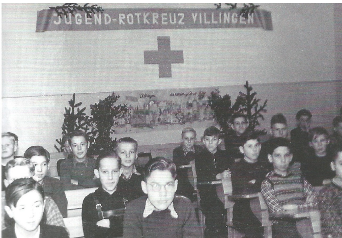
Jugendrotkreuz-Klasse Pestalozzischule Villingen 1950

Besonderen Dank gilt der Sparkasse Schwarzwald-Baar für finanzielle Unterstützung und der Firma Kleider Müller für die Bereitstellung der Kleiderpuppen, für die Ausstellung von Uniformen und Jugendrotkreuz-Bekleidung.