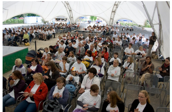
Eröffnung des Schulsanitätsdiensttag auf der Landesgartenschau 2010 in Villingen-Schwenningen

2000 organisiert das Jugendrotkreuz im DRK-Kreisverband Villingen-Schwenningen das erste Camp am Stöcklewald. Motto ist der 75. Jugendrotkreuz-Geburtstag. Die große bundesweite Geburtstagsparty zum 75. findet in Hannover mit dem Supercamp statt. Parallel zur Expo'2000. Hier nehmen auch Teilnehmer aus dem Kreisverband teil. Während der gesamten Expo'2000 in Hannover übernimmt das Jugendrotkreuz die Kinderbetreuung im Kinderbahnhof Wunderland zu-