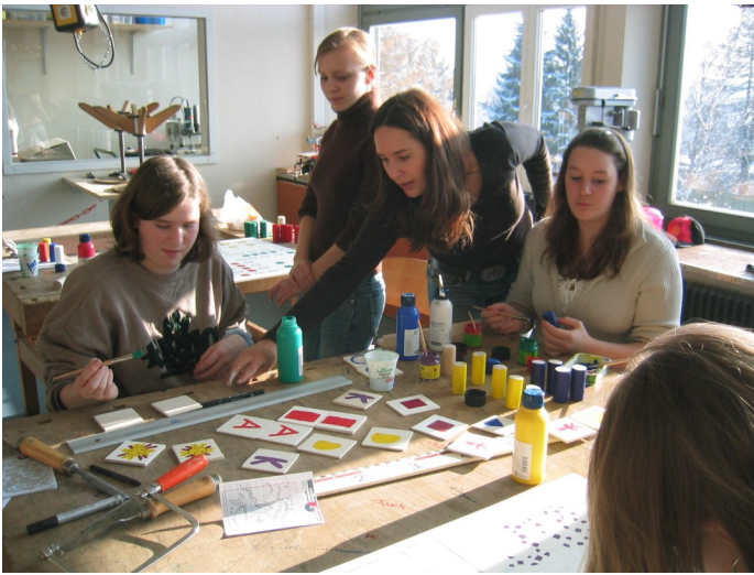
Im Werkraum der Goldenbühlschule werden Brettspiele aus Holz für die Adventswunder-Aktion 2005 angefertigt

2007) setzt sich für arme Kinder und Jugendliche in Deutschland ein. Mit Aktionstagen, Film- und Theatervorführungen oder Straßenständen machen sie auf das Problem der Kinderarmut aufmerksam. Sie kommen mit Politikern ins Gespräch, um so eine langfristige Verbesserung der Situation zu erreichen und organisieren Aktionen, mit denen die Benachteiligung armer Kinder reduziert werden kann. Mit Aktionen zur Konsumerziehung und Schuldenprävention hinterfragen Jugendrotkreuzler ihren eigenen Umgang mit Geld und Konsum.