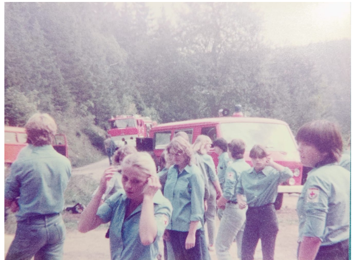
Übung mit der Feuerwehr und dem Jugendrotkreuz Schwenningen, ca. 1982, vermutlich Neckartäle