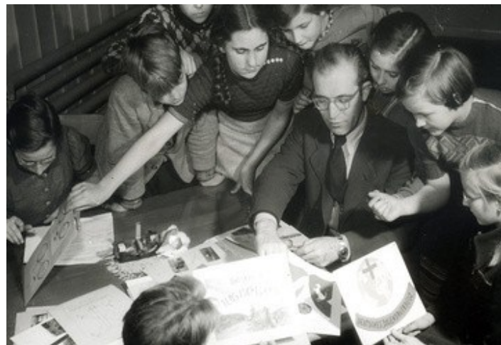
Der Anfang des Jugendrotkreuz war an den Schulen

Die Zeitschrift Deutsche Jugend, des Jugendrotkreuz, entwickelte sich zur beliebtesten Kinder- und Jugend-